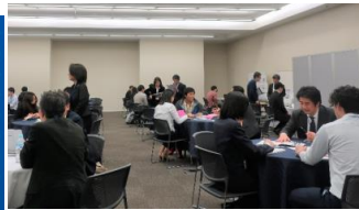
↓ 学生によるポスター発表