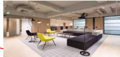
日本橋ライフサイエンスビルディング (UC サンディエゴ東京オフィス入居)