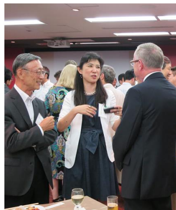
7月26日開催のUC サンディエゴ東京拠点開設の記念シンポジウムおよび交流会の様子