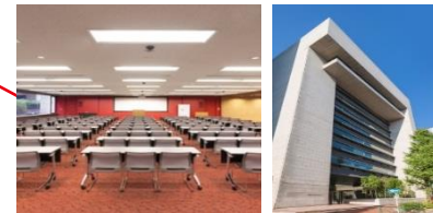
日本橋ライフサイエンスハブ