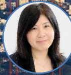
秦由佳氏 産業革新投資機構