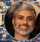
Devang Thakor Anioplex, LLC