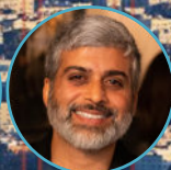
Devang Thakor Anioplex, LLC