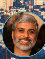
Devang Thakor Anioplex, LLC