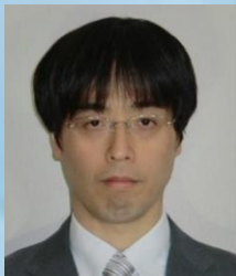
慶應義塾大学病院 臨床研究推進センター客員准教授 第一三共株式会社