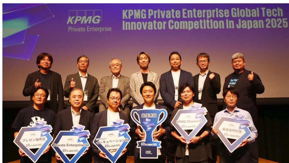
2025年大会の受賞者と審査員の皆様